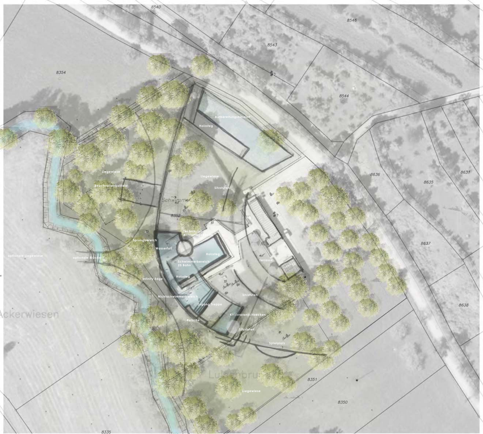
Grundrisssskizze Variante 1